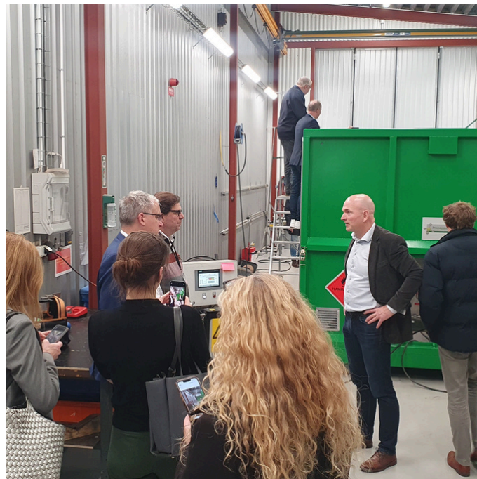
Werksbesichtigung bei Processkontroll Green Technology in Stora Höga.

Mit einer klaren politischen Rahmensetzung und der Förderung innovativer Technologien können Lösungen aus Schweden dazu beitragen, die Herausforderungen des deutschen Biogassektors erfolgreich zu meistern. Die Integration von Biomethan und grünen Wasserstofflösungen in Energie- und Verkehrssysteme bietet ein enormes Potenzial für eine nachhaltige und fossile-unabhängige Zukunft.