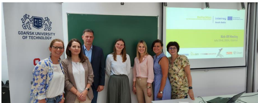
Kick-off für das BePacMan-Projekt in der Technischen Universität Danzig.

(Aktuell sucht enviMV nach einem Projektbearbeiter/in, der die Bearbeitung des BePacMan-Projektes ab November dieses Jahres übernehmen kann.)