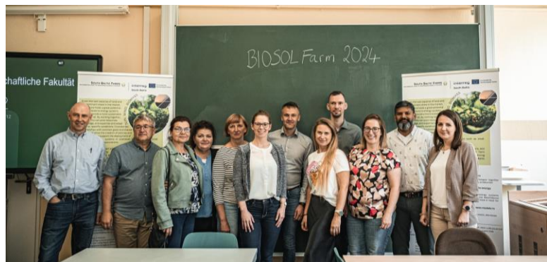
Konsortium des BIOSOLFarm-Projektes während Projektkonferenz in Rostock.

Für das seit September 2023 laufende Förderprojekt BIOSOLFarm (South baltic farms- an essential part of renewable energy) wurde am 22. März ein Workshop mit dem enviMV-Mitglied mele Biogas GmbH sowie dem DBFZ (Deutsches Biomasseforschungszentrum) zum Know-how Transfer zum Thema Biogas organisiert. Im gleichen Projekt wurde außerdem in den Räumen der Universität Rostock die erste mehrtägige Projektkonferenz von enviMV in Zusammenarbeit mit Projektpartnern der Universität Rostock geplant und durchgeführt. Während der Konferenz vom 18.-21. Juni wurden drei Study Touren für die Projektpartner sowie eine öffentliche Tagung mit 9 Beiträgen zum Thema „Förderung der erneuerbaren Energien „erfolgreich durchgeführt.